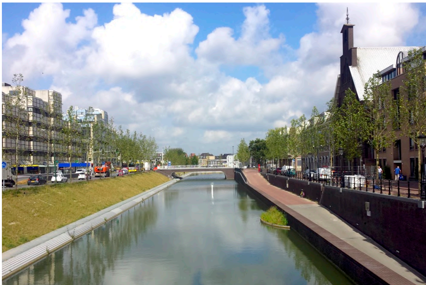
Stadsbuitengracht à Utrecht, Pays-Bas. Vue depuis le pont - "Vredenburgknoop" vers le nord. Le Stadsbuitengracht partie ouest des douves de la ville médiévale, qui avait été transformé en 1973 en un système routier urbain de 6 à 8 voies. De 2010 à 2020 l'ancien système de douves a été entièrement restauré.

Les présentations seront faites pendant l'Assemblée Générale d'automne de l'ECTP-CEU, à Bilbao, Espagne, au cours de l'après-midi du 23 novembre 2024. Les sessions matinales de l'Assemblée Générale ne sont ouvertes qu'aux seuls délégués officiels, tandis que les sessions de l'après-midi, y compris les présentations des Jeunes Urbanistes et les débats sont ouvertes à tous. Après la session des deux heures qui leur est dédiée, les Jeunes Urbanistes ont la possibilité - de la même manière que l'année dernière à Gdansk - de participer à la session de l'atelier de l'ECTP-CEU "Planifier en pratique" qui se tiendra pendant les deux dernières heures de la journée.