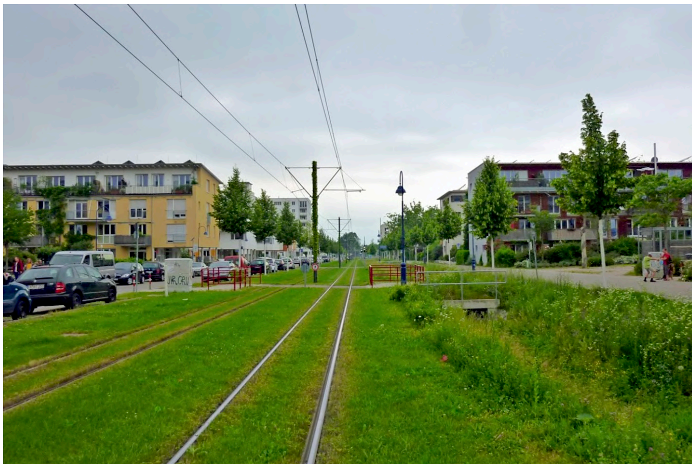
Vaubanallee (Avenue Vauban) à Fribourg, Allemagne. Vauban est le quartier le plus récent. C'est une ancienne base militaire, créée en 1937 par les Forces armées allemandes Nazi, puis utilisée par les Forces Françaises en Allemagne sous le nom de "Quartier Vauban". Après 1992, il a été reconverti en un quartier durable avec réduction des déplacements automobiles.

Les projets des participants devront explorer et proposer de nouvelles solutions pour le logement dans le contexte des défis contemporains et futurs auxquels sont confrontées les aires urbaines, en considérant les points suivants comme essentiels pour créer de nouvelles structures d'habitat qui soient innovantes, durables et agréables à vivre :