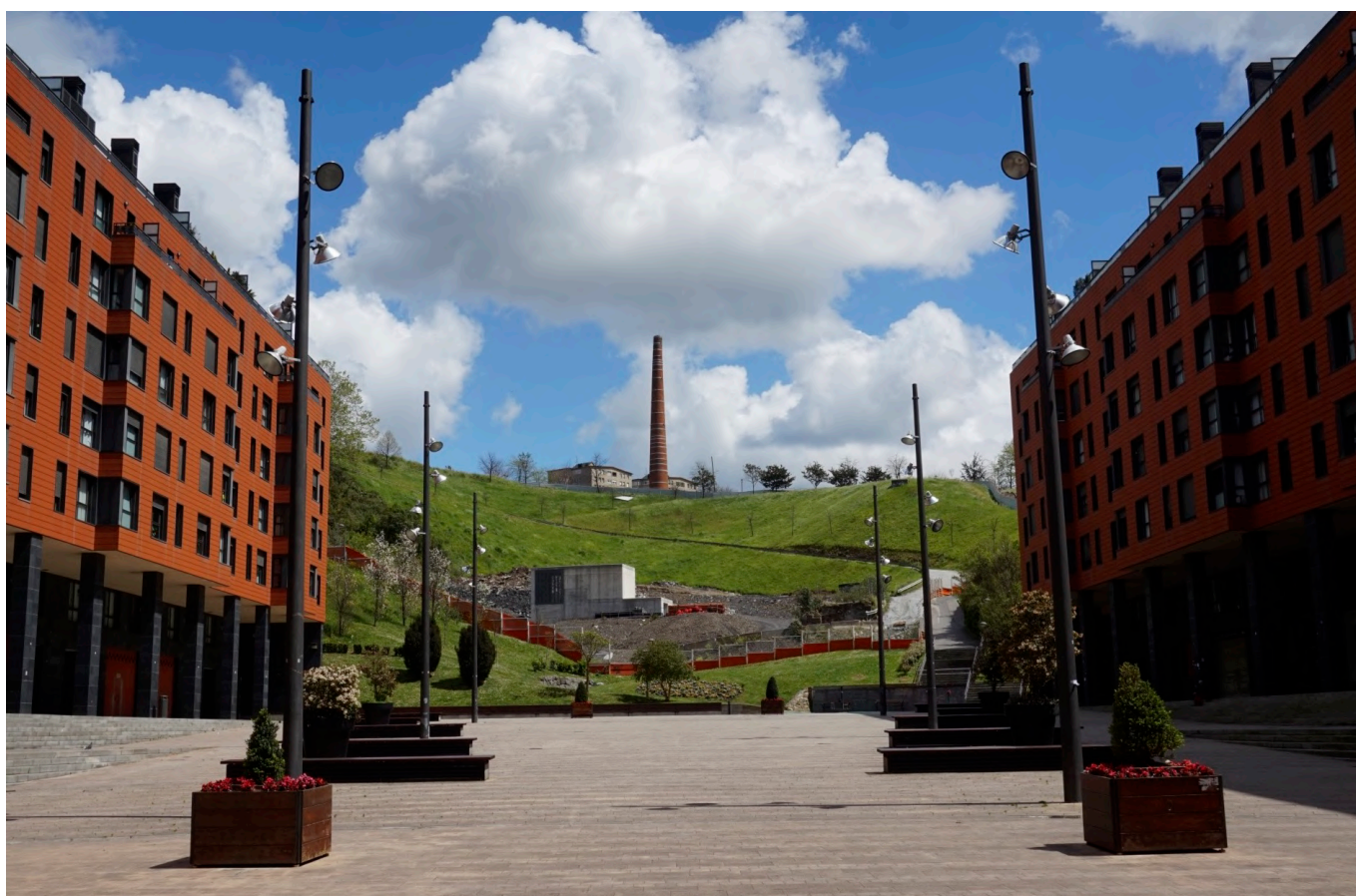
Cheminée en briques au Parc Etxebarria à Bilbao, 2016. C'est le titre que le photographe Matt Kieffer a donné à son travail. La photo est prise depuis la Plaza del Gas - Gas Plaza vers le parc, qui est l'aboutissement d'un important projet de reconversion d'une ancienne fonderie, mené dans les années 1980 et achevé en juillet 2023. Aujourd'hui le Parc Etxebarria est le plus grand parc urbain de Bilbao.